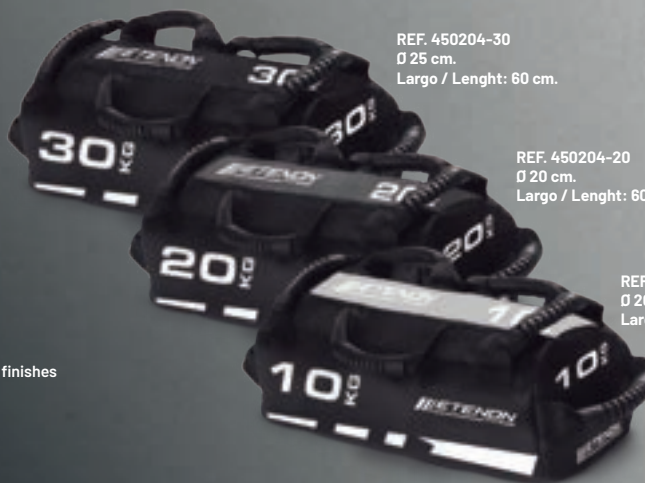
REF. 450204-30 Ø 25 cm. Largo / Length: 60 cm.